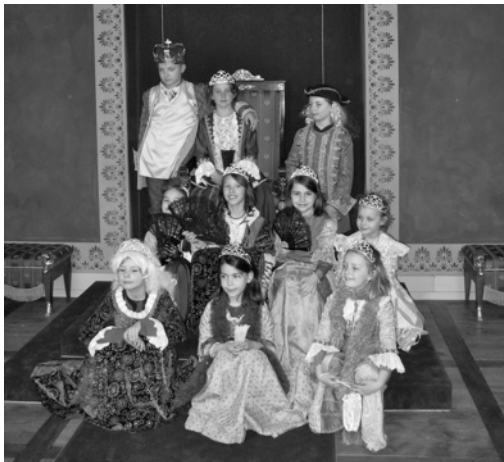
Ludwigsburger Schloss - April 2010